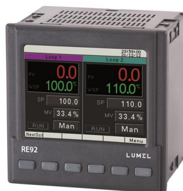
RE 92 96x96